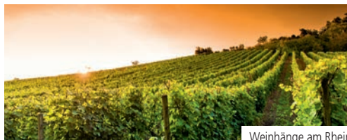
Weinhänge am Rhein